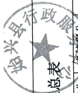
2019年乡镇公共服务中心考核汇总表