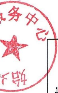
始兴县村委会银行账号收集及2019年省级补资金下发明细表