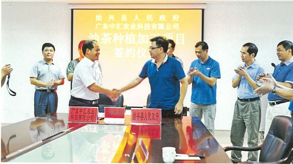
◀ 8月14日，始兴县签约油茶种植项目