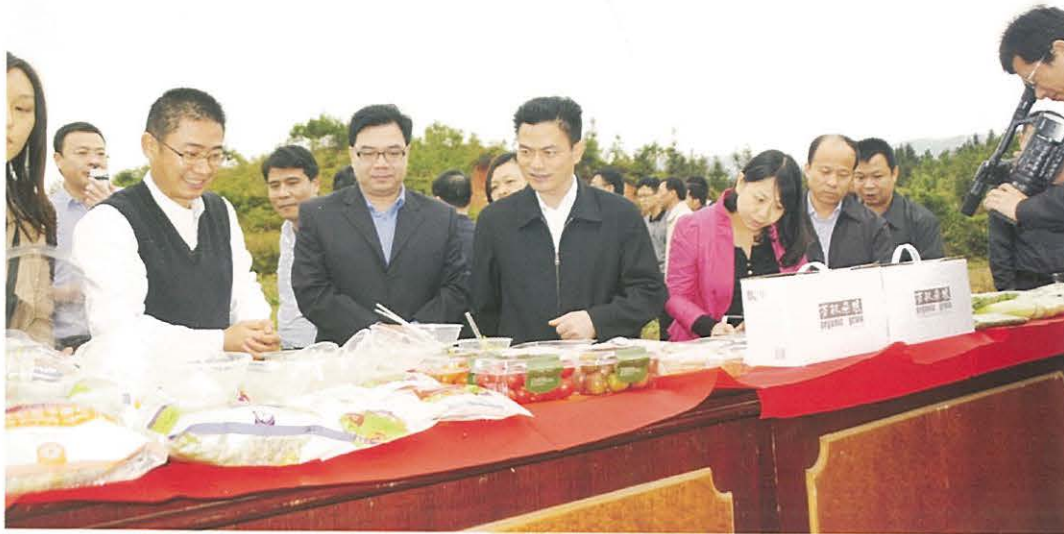
◀ 11月13日，始兴县召开加快乡镇发展现场会