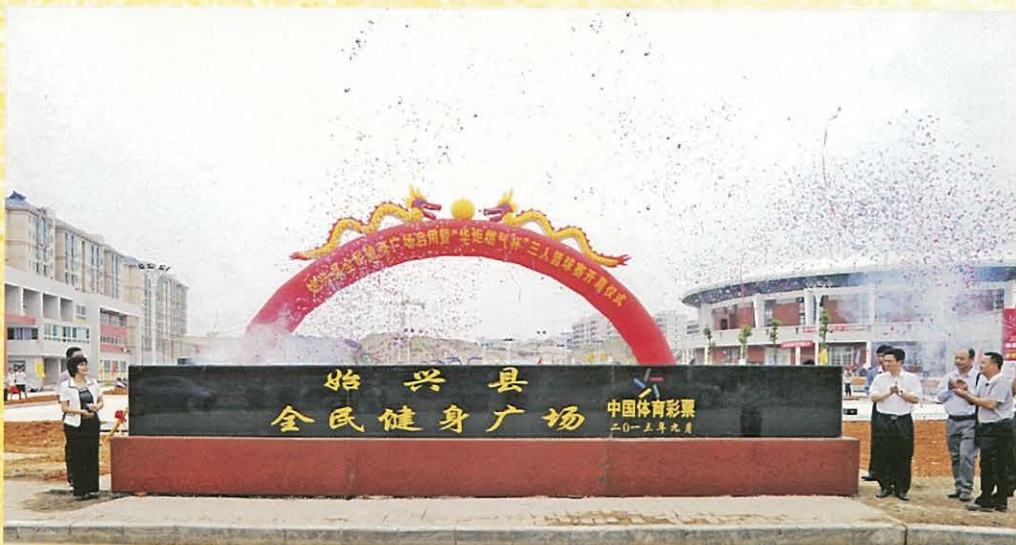
◀ 9月30日，始兴县全民健身广场建成启用