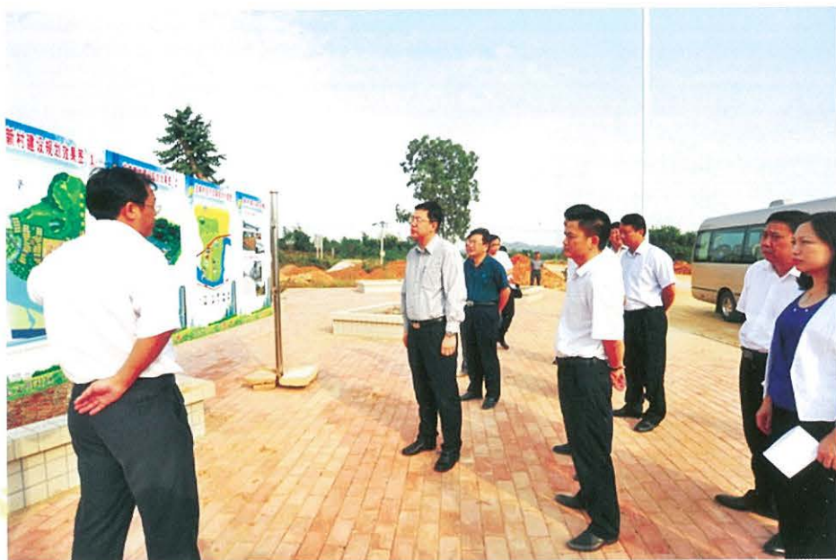
► 2013年10月17日，韶关市市长艾学峰一行到始兴总甫新村调研