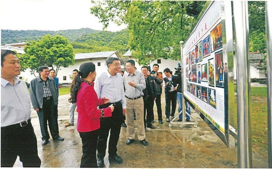
◀ 4月1日，广东省副省长许瑞生（前左三）到始兴调研