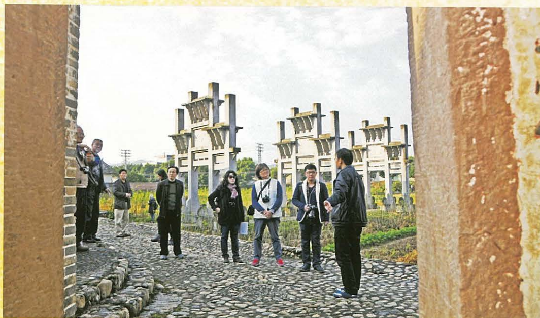
◀ 11月28日，台湾媒体到始兴采访