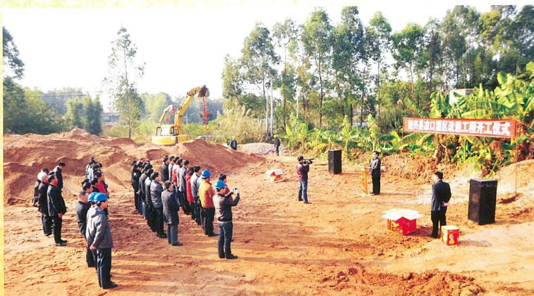
▶ 12月20日， 始兴县凉口灌区改 造工程动工 （温汉良 摄）