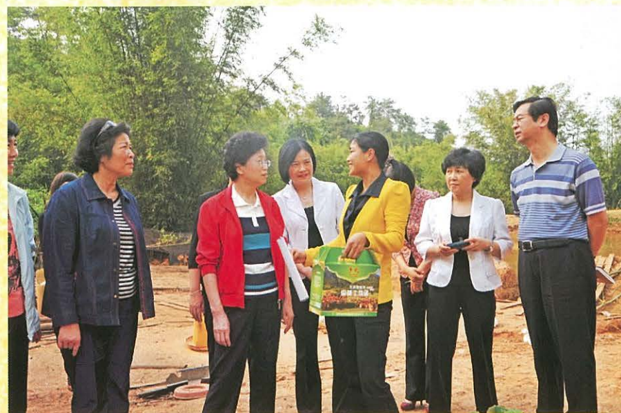
◀3月23日，全国妇联副主席宋秀岩（左三）到始兴考察