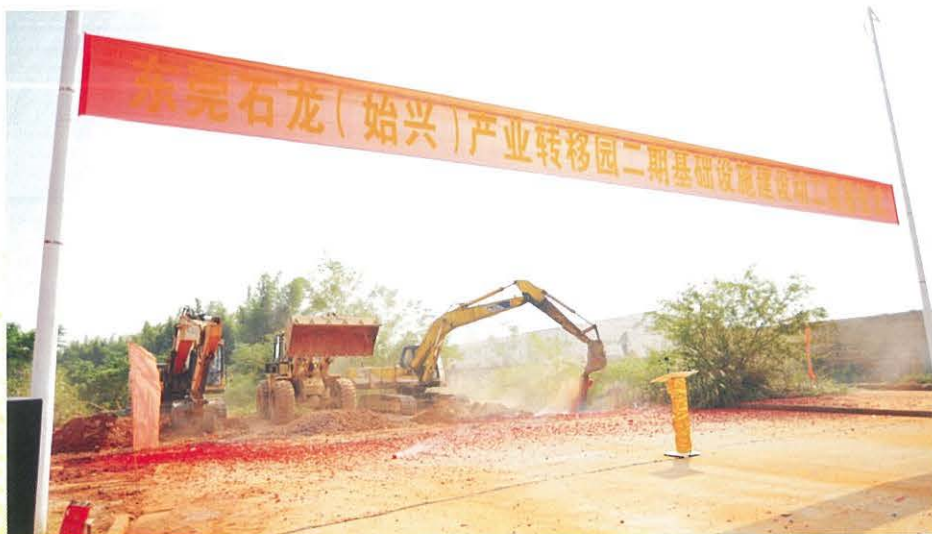
◀ 10月31日，东莞石龙（始兴）产业转移园二期动工仪式