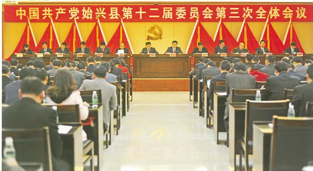
◀ 1月23日上午， 中共始兴县委十二届三 次全会开幕