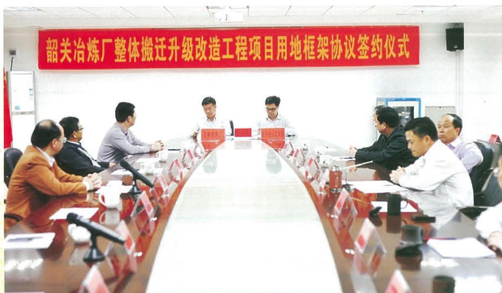
◀ 4月23日下午，始兴县举行韶关冶炼厂整体搬迁升级改造工程项目用地框架协议签约仪式