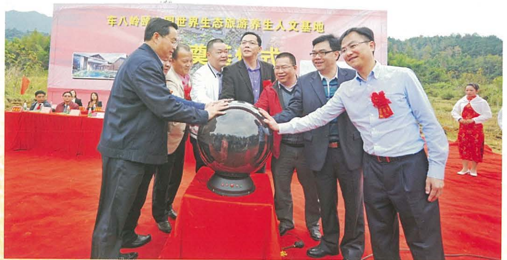
▶ 11月20日，车八岭颐心园世界生态旅游养生人文基地开工