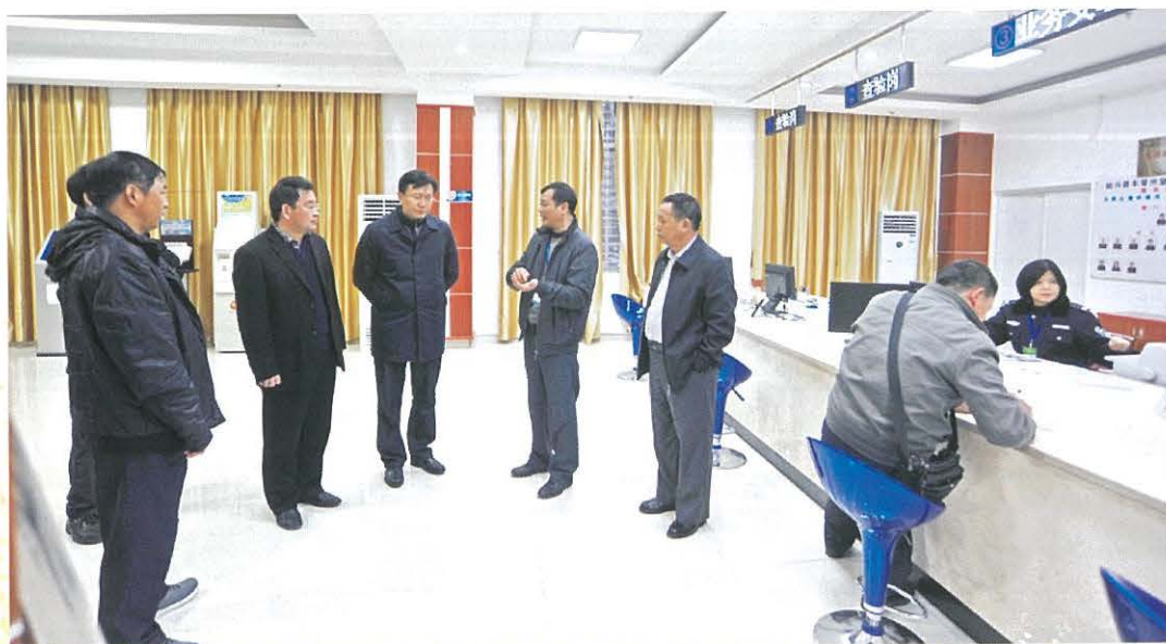
◀ 12月18日， 韶关市委副书记陈 向新（中）到始兴 县调研